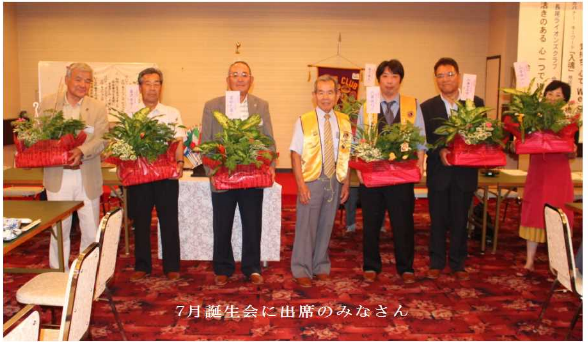
7月誕生会に出席のみなさん