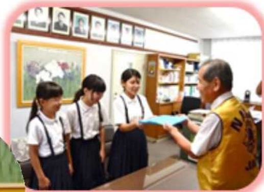
石田小学校 6年生代表へ