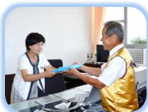
さぬき南小学校 向山校長へ