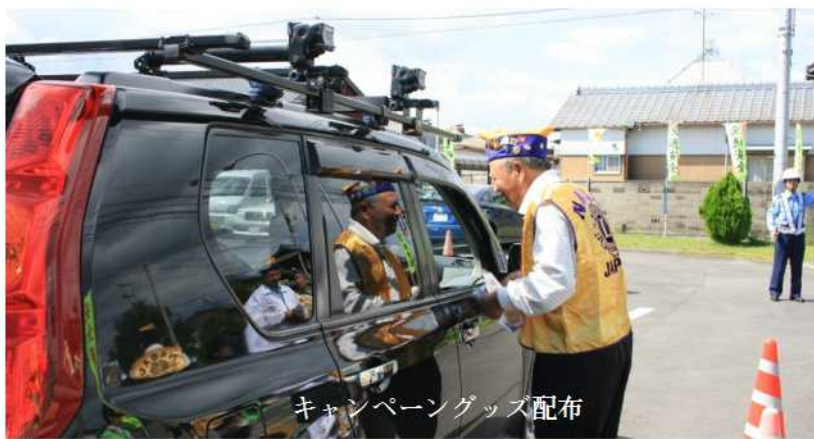
キャンペーングッズ配布

キャンペーンでは、「子どもと高齢者の交通事故防止」を呼びかけるパンフレットと事故ナシとして梨2個が入ったキャンペーングッズをドライバーに配り安全運転を呼びかけました。