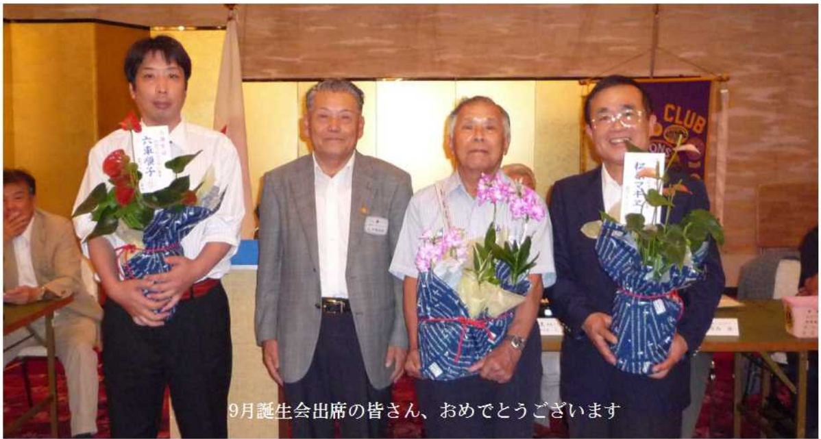
9月誕生会出席の皆さん、おめでとうございます