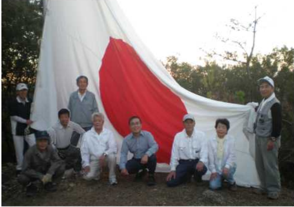
1名ほど集合写真撮影のシャッター係で交代のため合成してあります。お疲れ様でした。