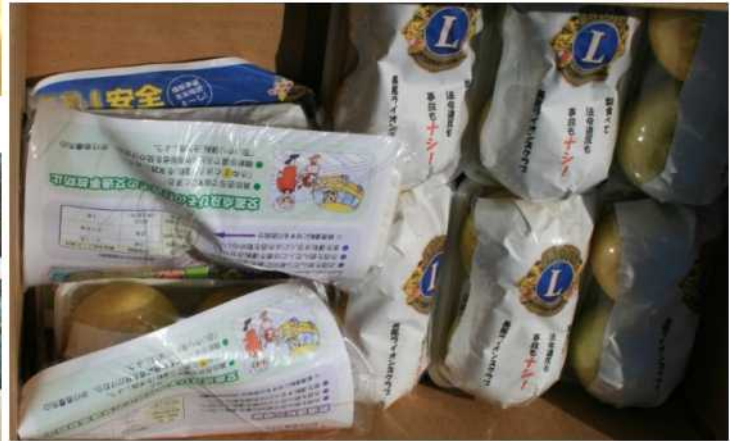
キャンペーングッズ：事故ナシ(梨)