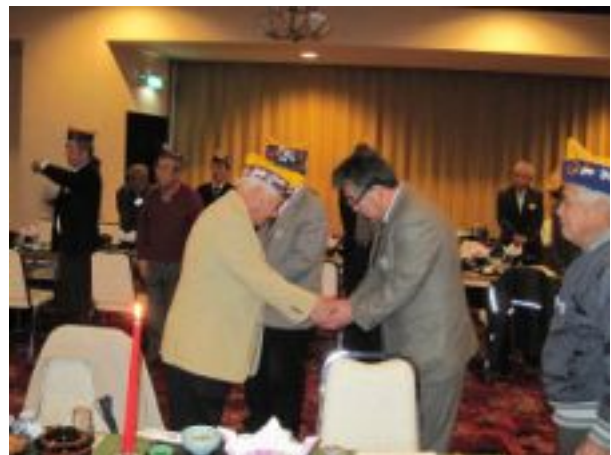
各会員と仲間入りの握手